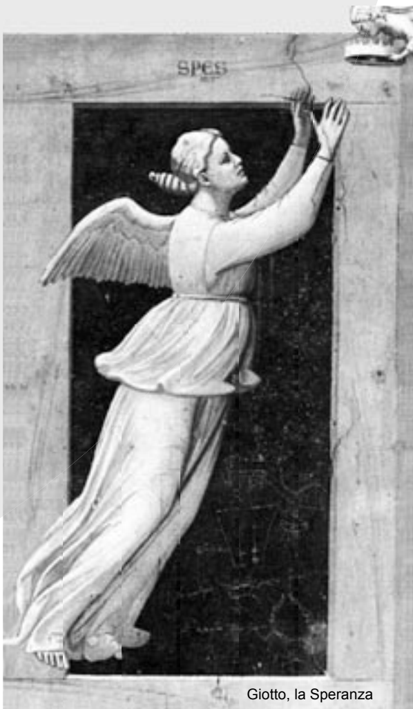
Giotto, la Speranza

non ci dai garanzie: da qui viene il nostro atteggiamento di ripiegamento a caccia di sicurezza ed è per questo che la testimonianza cristiana è molto povera e mediocre. Per questo il Papa ci sollecita e rinfranca riportando esempi di testimoni della fede che hanno vissuto la loro speranza fino alle estreme conseguenze. Ecco, allora, l'immagine di una schiava, Santa Bakhita. Appena conobbe Dio capì che tutto le era automaticamente garantito.